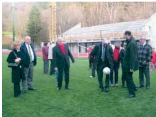
Après avoir foulé la magnifique piste d'athlétisme aujourd'hui achevée, les élus ont entrepris une partie de football improvisée sur la pelouse en gazon synthétique qui offrira d'excellentes conditions d'entraînement aux footballeurs tout au long de l'année.