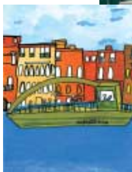
"Vaporetto" dessin d'Elsa Delobel