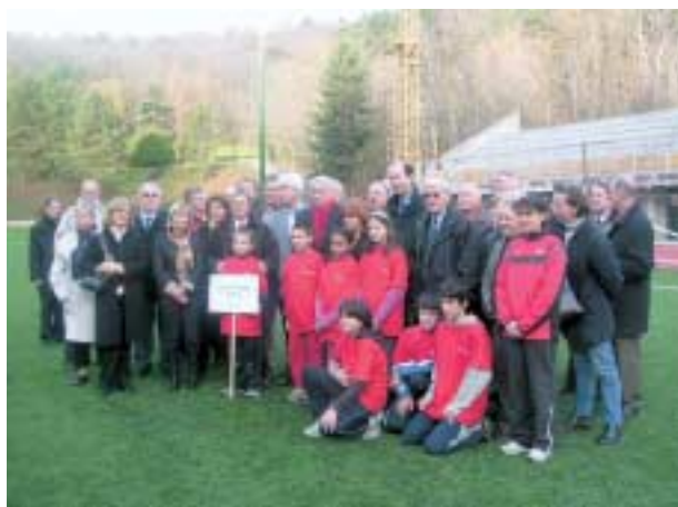
Les participants à cette visite de chantier, avec en arrière plan la tribune du stade en cours de construction.

Le Parc Omnisport du Colombier sera opérationnel pour la saison sportive 2007/2008. Sont actuellement en voie d'achèvement les aires de saut et de lancer ainsi que les bâtiments, tribune, vestiaires, logement de concierge.