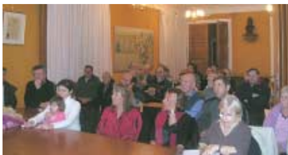
Une réunion d'information a été organisée par la Municipalité, jeudi 23 novembre à l'intention des habitants du quartier, pendant laquelle le Maire et les responsables du projet leur ont présenté les tenants et aboutissants.

A l'horizon du printemps 2008, le secteur dit des " Cités " connaîtra une évolution significative, avec la réalisation d'un projet qui permettra la création d'une trentaine de nouveaux logements de type privatifs et conventionnés, dans un ensemble où la qualité du cadre de vie constitue l'élément prioritaire : c'est le projet des " Terrasses de Montjoly ". Une résidence qui prendra la place de l'ancienne caserne des pompiers, qui a été démolie début décembre. Deux cités vont aussi être démolies afin de réussir ce