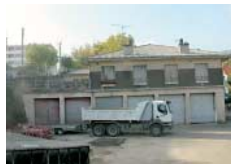
L'ancienne caserne des pompiers aujourd'hui démolie.

projet où environnement, urbanisme et logements sociaux sont étroitement associés. L'architecture en cascade épouse la pente de l'avenue Massenet. Les terrasses de l'immeuble donneront sur un jardin d'environ 1000 m 2 .