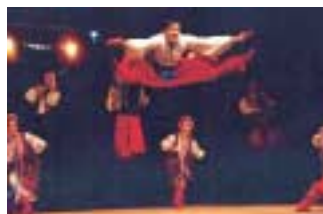
Lors du spectacle donné par la compagnie Russe Troika qui s'est déroulé en présence de nombreux élus et représentants associatifs de la ville.

L a Russie à l'honneur lors de la soirée des associations organisée par le comité d'animation au casino de Royat Chamalières en novembre.