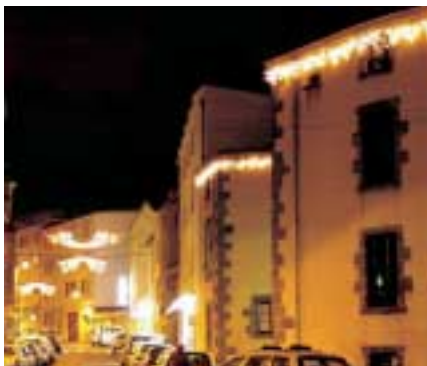
Les illuminations mises en place par la ville à l'occasion des fêtes de fin d'année.

Louis Giscard d'Estaing Maire de Chamalières