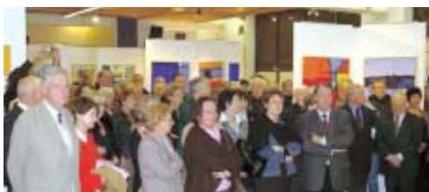
Le public lors du vernissage de l'exposition.