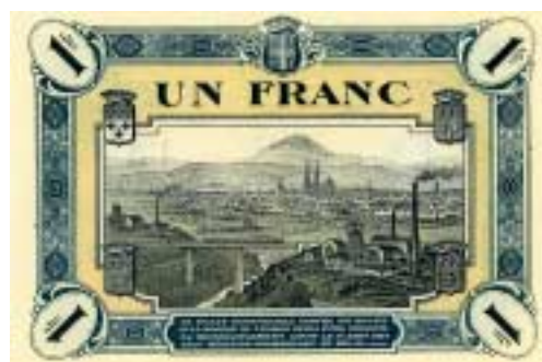
Le verso d'un billet de nécessité de 1 Franc émis par la Région Economique du Centre en 1921 pour pallier le manque de monnaie, le plus petit billet de la Banque de France étant de 5 Francs.

Le Club Auvergne Papier Monnaie se réunit chaque 4ème samedi du mois à partir de 9 H 30 à la Maison des Associations. Renseignements : tel : 04 73 84 82 40.