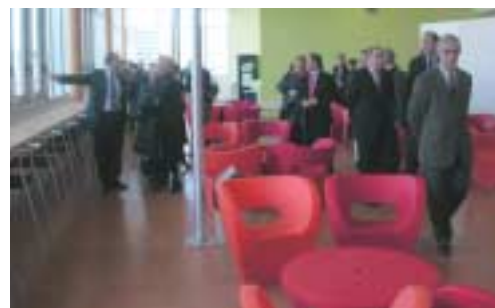
Dans la cafétéria de l'IUFM

Ces travaux ont permis d'embellir, et de sécuriser, les abords. D'autres aménagements suivront prochainement.