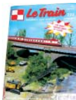
La couverture du magazine qui montre le pont d'Abrest, nouvel ouvrage d'art réalisé par l'Arverne Ferroviaire Miniature Club.