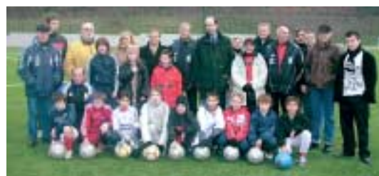
Lors d'un entraînement en nocturne.

Les footballeurs peuvent s'entraîner depuis mi-décembre sur un gazon synthétique qui leur procure la plus vive satisfaction. La puissance de l'éclairage permet de plus des conditions de jeu particulièrement agréables.