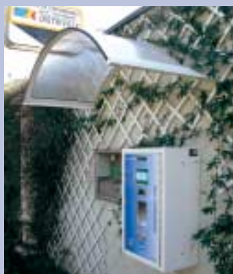
Borne de paiement - Parcoville n°1 Square de Verdun, côté droit du parcoville

Un système d'achat de cartes parcoville préchargées à 15 euros, au moyen d'une carte bancaire, vient d'être mis en place. Cette carte parcoville pourra ensuite être rechargée par espèces. Cela répond à la demande formulée de longue date de pouvoir accéder aux parcovilles avec une carte bancaire.