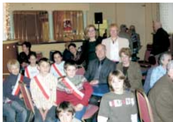
Nos édiles en culotte courte ont rejoint leurs aînés au Casino de Royat afin de partager avec eux la traditionnelle galette de l'âge d'or.

La Communication a été à l'honneur : proposition d'une page dévolue au CMJ sur le site WEB de la commune et projet de création d'un logo du CMJ.