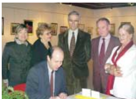
M. le Maire signe le livre d'or de l'exposition

Une dizaine d'adhérents présentaient leurs œuvres peintes du 10 au 18 février à la Galerie Municipale.