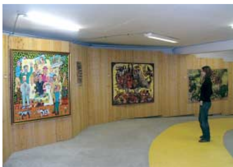
Dans l'espace "Triennale".