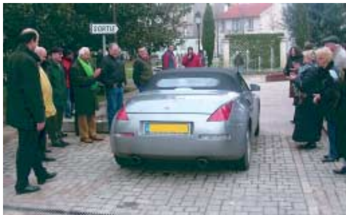
Une inauguration... très vivante qui s'est déroulée en présence de nombreux élus...et de voitures !

A fin de faciliter et surtout de rationaliser la circulation des véhicules, notamment pendant les heures de pointe, la Ville a décidé d'aménager une nouvelle sortie du parking donnant sur la rue Charles Fournier. Chantier débuté en septembre 2006 et inauguré le 15 décembre 2006 et dont le coût avoisine 60 000 €.