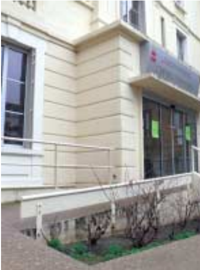
Rampe handicapés à l'entrée du C.C.A.S.

La Municipalité de Chamalières a mis en place jeudi 9 février en mairie une commission communale d'accessibilité des handicapés. (Sur proposition du Maire, le conseil municipal du 14 décembre 2006, avait approuvé le principe de création de ladite commission). La Ville souhaite appliquer la Loi du 12 février 2005 pour l'égalité des droits et des chances, et rendre Chamalières plus pratique et solidaire.