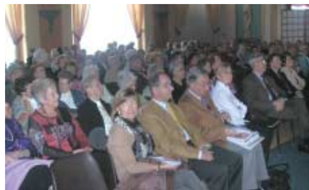
Lors du spectacle offert au Casino de Royat, à l'occasion de la galette de l'Age d'Or.