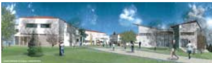
Une vue de synthèse de la future architecture qui prévaudra dans le Centre.

P rélude à un vaste chantier de modernisation, les premières démolitions de bâtiments obsolètes sont intervenues en janvier. A l'horizon 2009, le Centre départemental de l'enfance et de la famille installé sur 2,8 hectares à Chamalières arborera un aspect profondément transformé. Le coût prévisionnel de cette importante opération est de 13 224 000 €. La prise en charge se répartit ainsi : 80 % financés par le Conseil Général, le reste étant payé par l'établissement. Rappelons que le centre peut accueillir 219 enfants et adolescents confiés par leurs parents ou par décision judiciaire. 126 personnes sont employées dans cet établissement public autonome.