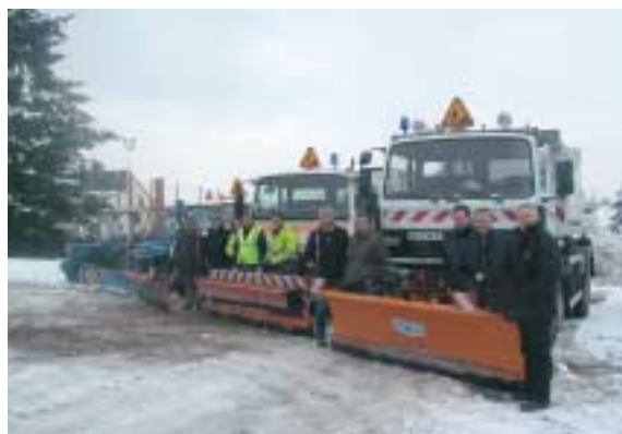
Une partie des employés de la ville, avec des engins de la ville chargés du déneigement de l'espace public fin janvier lors des abondantes chutes de neige qui se sont doublées d'une vague de froid, rendant la tâche plus difficile.

à l'œuvre, afin de déneiger au mieux trottoirs, escaliers et lieux publics.