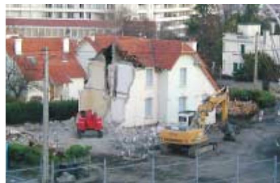
Une série de démolitions... spectaculaires qui permettront de faire naître une résidence avec des logements conventionnés, comprenant 1 000 m 2 d'espaces verts.