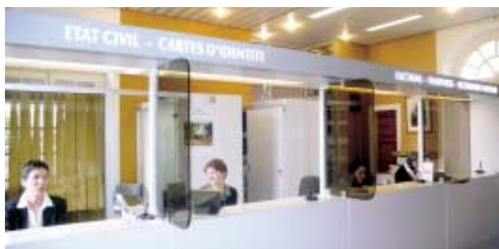
Les guichets d'accueil de la mairie de Chamalières où s'effectuent les demandes de papiers d'identité et passeports.

En 2007, les employés de l'état-civil de la mairie ont répondu à pas moins de 1395 demandes de cartes nationales d'identité, et ont délivré un total de 847 passeports . Statistiques : en moyenne près de 5 mariages ont été célébrés par mois en 2007 , soit un total de 61 sur l'année .