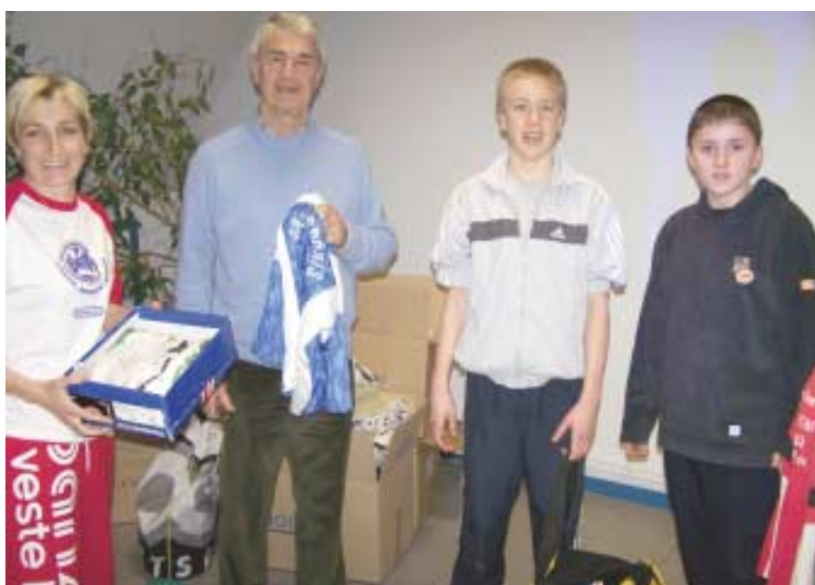
Les participants au 1 er challenge minime inter-régions organisé par l'Etoile de Chamalières.