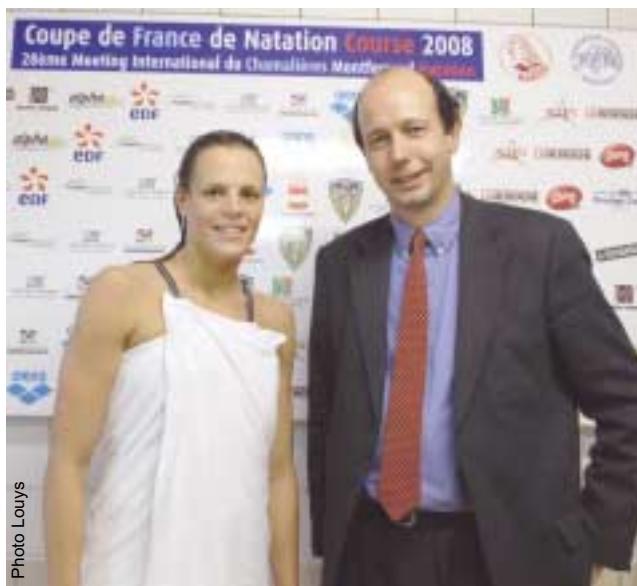
Louis GISCARD d'ESTAING, député maire, avec Laure MANAUDOU la star de la natation Française au centre aquatique de Chamalières.

Le Centre Aquatique de Chamalières a connu l'affluence des grands jours lors de la 1 ème étape de la Coupe de France 2008. Ce 28 ème meeting international organisé par le Chamalières Montferrand Natation a été celui de tous les records. Au cours de l'édition 2007, 6 avaient été battus. Cette fois-ci pas moins de 13 records sont tombés ! La fréquentation du public n'a, par ailleurs, jamais été aussi importante. Il est vrai que l'affiche avait de quoi séduire, avec la participation de Laure MANAUDOU et d' Alain BERNARD , le spécialiste du 100 mètres.