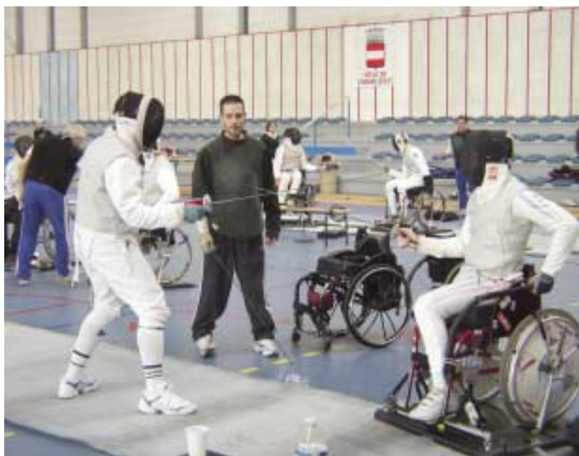
Un match de démonstration entre l'équipe de France handisport et l'équipe valide de Chamalières se déroulant le 7 mars. Victoire des handisports 45 à 37.