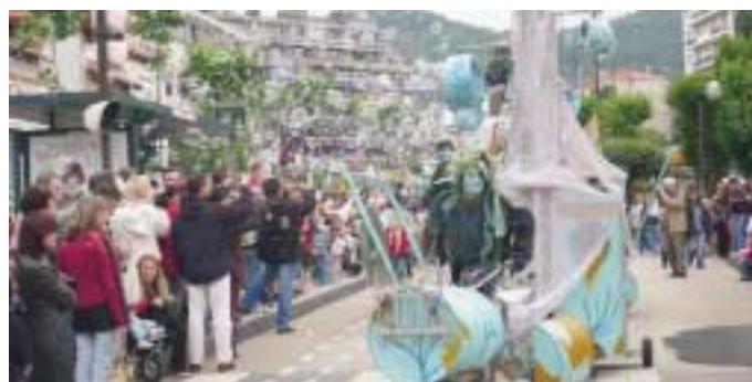
Lors de l'édition 2007 de la fête de la ville.