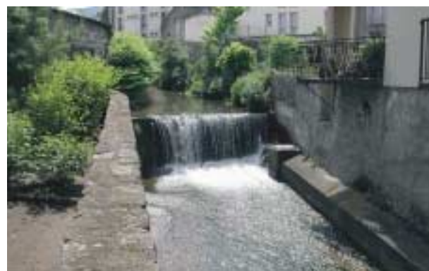
La Tiretaine au niveau de la Maison des Associations.