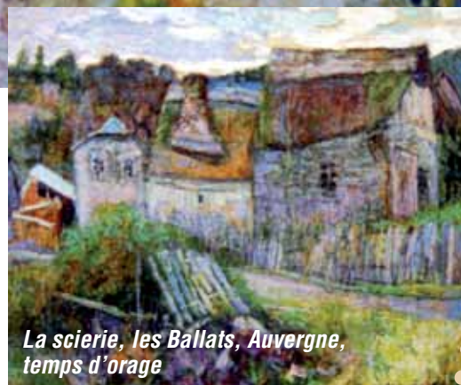
La scierie, les Ballats, Auvergne, temps d'orage

Du 23 mars au 7 avril 2013, salle du Carrefour Europe.