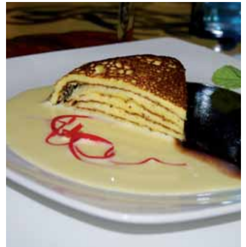
Recette de la Brasserie La Passerelle 4 Allée du Parc, 63400 Chamalières Téléphone : 04 73 36 15 89