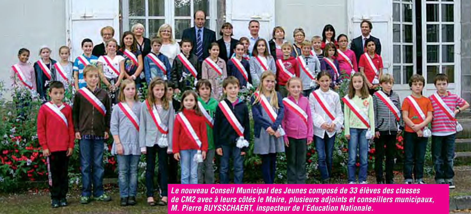
Le nouveau Conseil Municipal des Jeunes composé de 33 élèves des classes de CM2 avec à leurs côtés le Maire, plusieurs adjoints et conseillers municipaux, M. Pierre BUYSSCHAERT, inspecteur de l'Éducation Nationale.