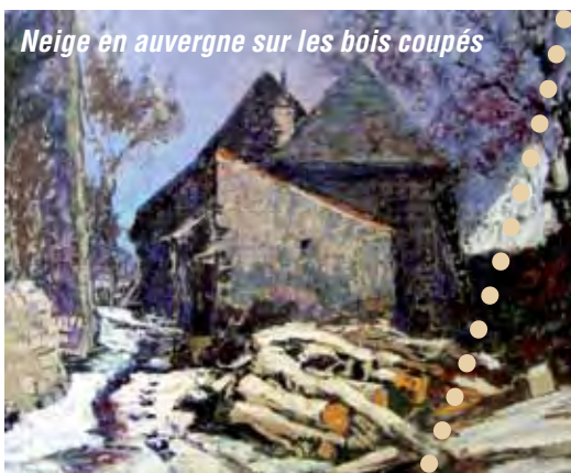
Neige en auvergne sur les bois coupés