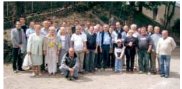
Le Gentleman de pétanque à Fontmaure.