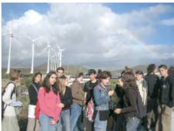
Les jeunes chamaliérois aux Canaries

D epuis plusieurs années déjà, les institutions scolaires de Chamalières participent à divers programmes d'échanges linguistiques, une manière pour ces collégiens et lycéens de découvrir le monde et de pratiquer la langue qu'ils étudient. Quatre échanges ont eu lieu en Mars et Avril.