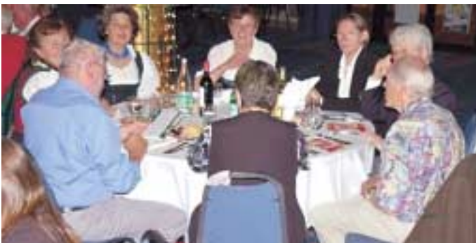
Lors de la soirée franco bavaroise à laquelle ont pris part 220 convives au Casino le 2 juin.