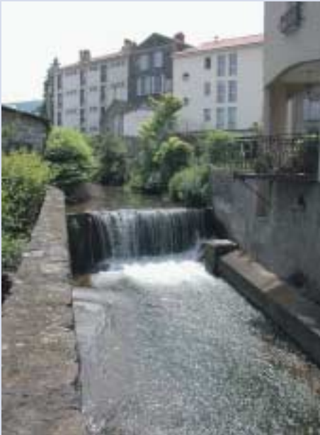
Aux abords de la Maison des Associations.