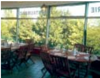
La Brasserie SAS est ouverte 7 jours/7 de 10h à 15h.

L'été arrive et... par conséquent, le centre aquatique change d'horaires.