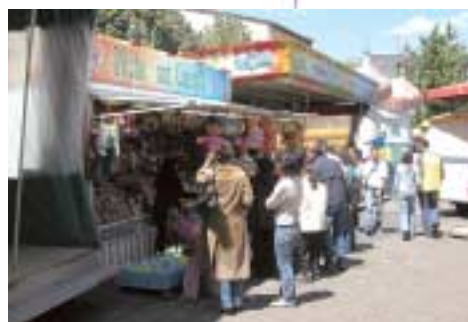
La fête foraine.