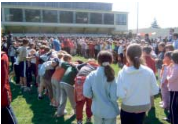
"Mêlée géante" pour les 40 ans du rugby.