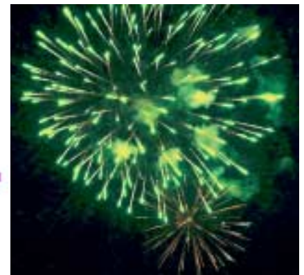
Le Feu d'artifice tiré avenue de Fontmaure au Carrefour Europe : les spectateurs en ont pris plein les yeux !