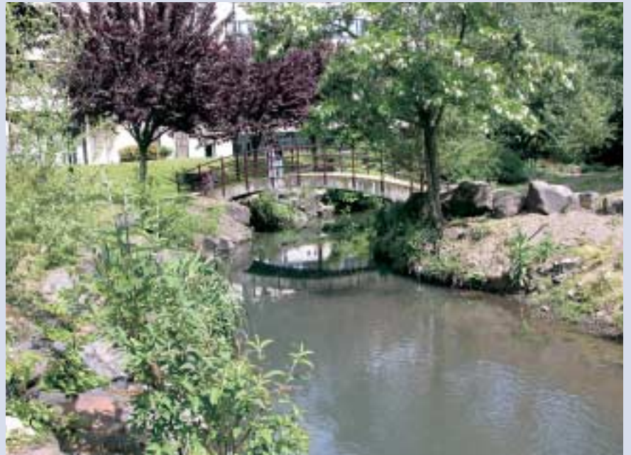
La Tiretaine à Beaulieu.