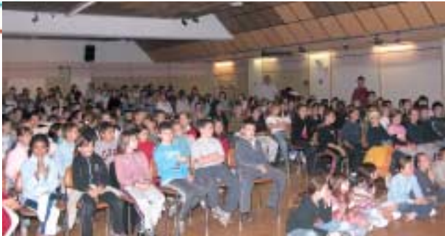
Lors de la conférence de l'alpiniste Jean-Pierre Frachon.